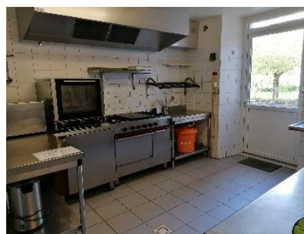
Location de la cuisine et de la plonge

Salle de 80m 2 , ouverte sur la terrasse, vue sur le parc,