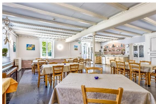
Location de la salle à manger

Salle de 80m 2 , ouverte sur la terrasse, vue sur le parc,